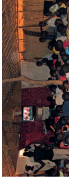
V Malawi existují tisíce kin.

Projekt Zione v malawiských kinech rozeznal osvětové potenciál malawiských video-center, která většinou vysílají americké akční filmy, a začal do nich distribuovat film Zione. Informace se tak dostane i do nejdlehlějších částí země.