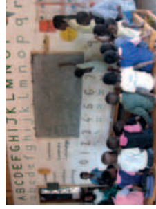
Modelová školka Umodzi-Mbame funguje od roku 2006.

boNGO zřizuje tzv. Modelové školky , které poskytují kvalitní předškolní výchovu a zároveň slouží jako školicí centra pro učitele okolních školek. Učitelé v Modelových školkách pocházejí z místních vesnic a jsou řádně proškolení k využívání různorodých učebních metod s důrazem na přístup „škola hrou“. Časem se někteří stávají školiteli dalších učitelů.