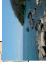
Jezero Malawi je důležitým zdrojem obživy.