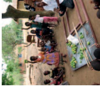
Běžné malawiské školky nemají řádné budovy.

V Malawi existuje téměř 6000 školek. Často fungují pouze pod stromem a chybí jim učební pomůcky a hračky. Vznikají z iniciativy vůdčích osobností komunit, které chápou důležitost předškolní výchovy, ale nemají potřebné prostředky ani zkušenosti. Učitelé jsou místní dobrovolníci bez potřebného vzdělání, kteří tuto činnost chápou jako své poslání, a nepobírají plat. Učí děti čísla, abecedu a jiné základní znalosti, ale výuka probíhá formou memoarování a neposkytuje tak dětem dostatek podnětů a stimulace.