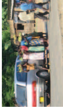
Svět chudoby a dostatku se prolínají.