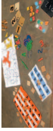
Učební pomůcky vyráběné během školení.

Školení kombinuje teorii i praxi. Klade důraz na kreativitu a vlastní iniciativu účastníků. Zároveň posiluje sebedůvěru, která učitelům často chybí.