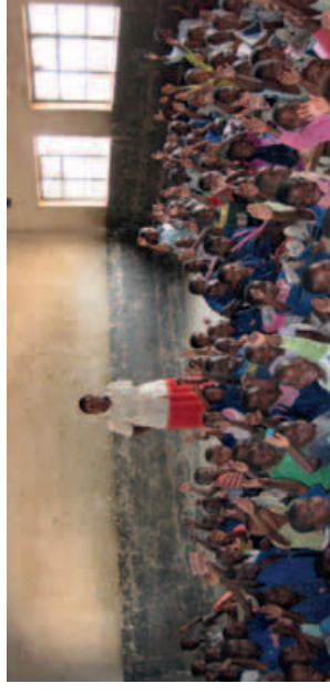
Malawiské třídy bývají holé a tmavé.

Ačkoli jsou základní školy v Malawi podporované státem, kvalita vzdělávání je nízká. K tomu přispívá zejména nedostatek učitelů a učebních pomůcek.