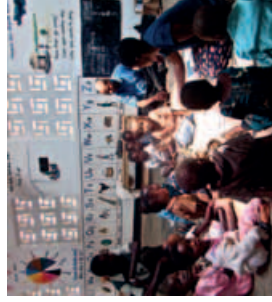
Mango - nová Modelová školka otevřená v roce 2011.

boNGO vyvinulo rekvalifikační Školení pro učitele , kteří nemají žádné pedagogické vzdělání. V rámci programu nezkoušení učitelé z běžných školek přicházejí sledovat výuku do Modelových školek, podílejí se na ní a pod odborným dohledem ji pak „imitují“ ve svých školkách. Součástí programu je i výroba učebních pomůcek.