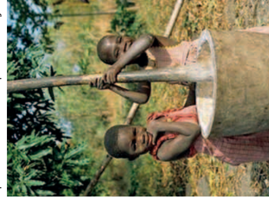
Holičky tlačou kukuřiči.

boNGO v Malawi působí od roku 2005. Je to nezisková organizace zřízená za účelem zlepšování kvality vzdělávání. Zpočátku se věnovala předškolní výchově, ale postupně