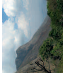
Pohoří Mulanje vysoké 3002 m.