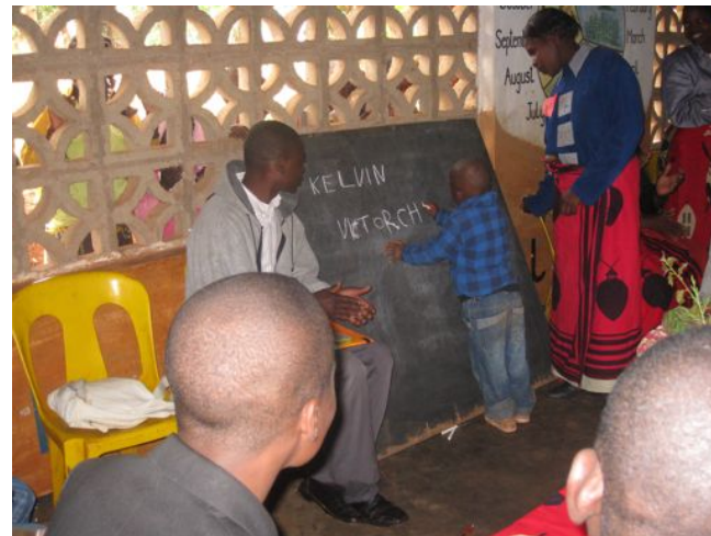
Děti ukázaly, jak dokáží psát, přednesly několik básniček a místní mládež odehrála krátké divadelní představení.