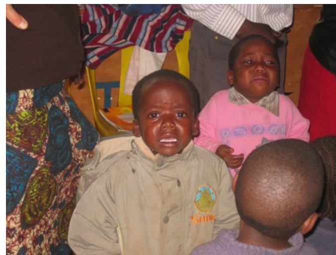
Protože školní batůžek byl jen pro ty, které odcházejí na základní školu, den se neobešel bez slz.