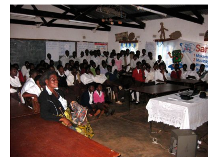
Zione na malawských školách