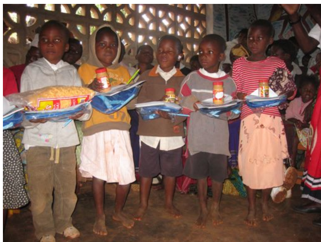
Děti dostaly vysvědčení, školní batůžek, sešit a burákové máslo.