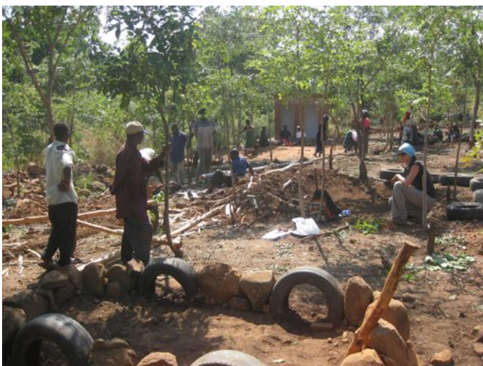
místní dobrovolníci při výstavbě školního hřiště