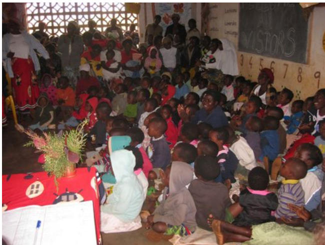
Rodiče, náčelníci okolních vesnic, vesničané a další se sešli, aby s dětmi oslavili konec školního roku.

7. července 2011 proběhlo slavností uzavření pátého školního roku v Modelové školce Umodzi-Mbame. 35 dětí odchází do prvních tříd a 50 přijde znovu v září. Školka již tradičně poskytuje velmi vysokou úroveň předškolní výchovy a žáci, kteří školkou prošli, se na základních třídách drží na prvních místech ... lépe se soustředí, rychleji chápou a snadněji se učí. Čtyři z osmi učitelů již rok pracují také jako školitelé a dvakrát měsíčně docházejí do dalších dvou školek, Living Word of God a Frenaso , jejich učitelé byli v Umodzi proškoleni. Tam monitorují způsob výuky a pomáhají, kde je třeba.