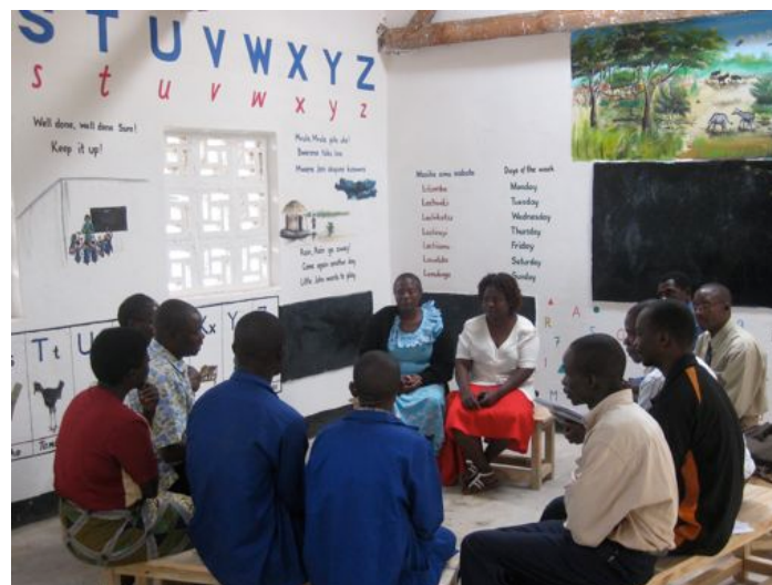
učitelé během teoretické části školení v nově vymalované třídě