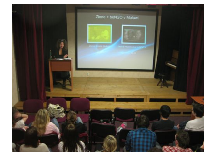
Zione na českých školách

Zasláním finančního příspěvku na transparentní sbírkový účet 6060660606/5500, podpoříte realizaci projektu “Zione na malawských školách” . Aby film shlédli jeden malawský student, je třeba 18 Kč.