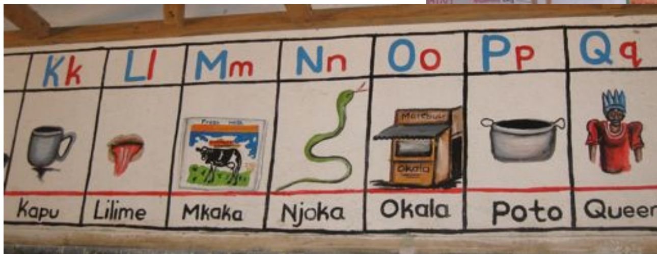
Mkaka v místním jazyce Chichewa znamená MLÉKO