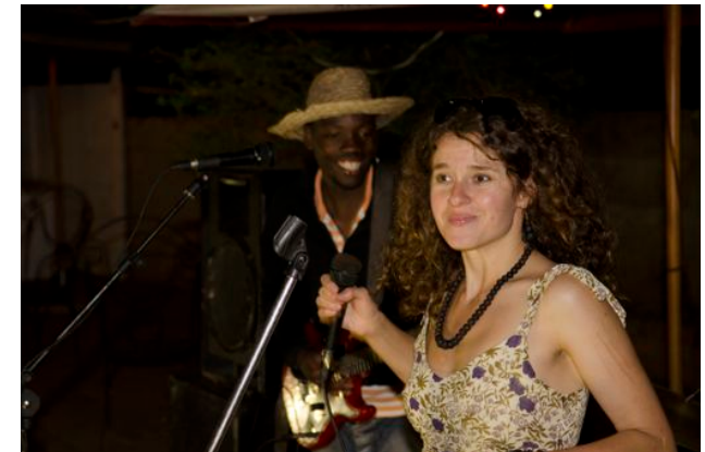
vystoupení na festivalu ve městě Blantyre

http://www.youtube.com/watch?v=sCR3UNuj58U