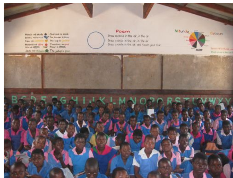
Každá vymalovaná třída přispěje ke zkvalitnění vzdělání více než deseti tisíc dětí.