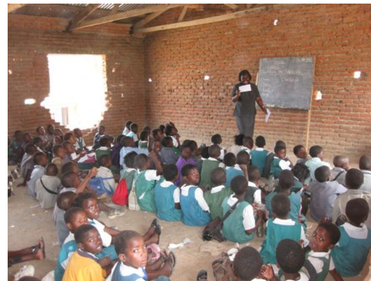
Některé třídy nejsou omítnuté a projekt by v nich mohl být realizován jen velmi nákladně. (ZŠ Ndirande ve městě Blantyre).