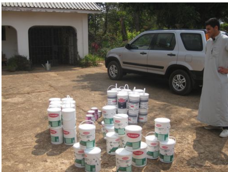
100.000 Kč, kterými projekt podpořila ERA od Poštovní Spořitelny, je využíváno především k výplatám pro malíře. Potřebné barvy (cca 17 litrů na jednu třídu) boNGO získává darem od místních výrobců.