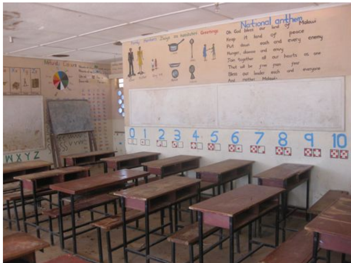
Projekt má velký ohlas a boNGO jej chce realizovat na všech státních základních školách v regionu Blantyre. Těch je více než 200 ... (ZŠ Chichiri ve městě Blantyre).