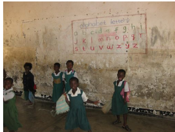
V některých školách lze sledovat "lidové snahy" o nástěnné vizuální pomůcky již před příchodem boNGO. (ZŠ Namatapa ve městě Blantyre)