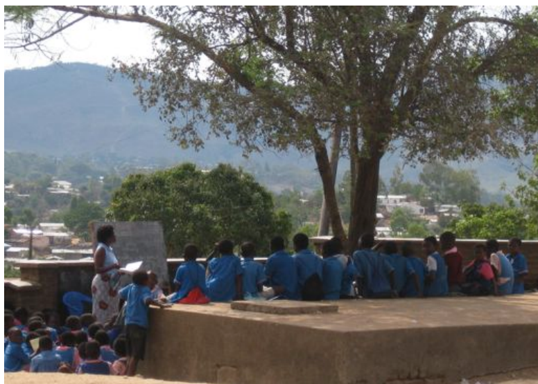
Některé třídy nemají ani stěny a projekt v nich nemůže být realizován vůbec .... (ZŠ Mbayani ve městě Blantyre)