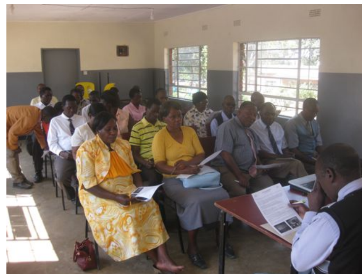
Setkání ředitelů škol v jedné z oblastí města Blantyre a boNGO. Na prvotním meetingu se hovoří o podmínkách projektu a nutnosti podpory ze strany školních a rodičovských výborů při přípravě stěn k vymalování.