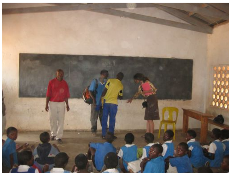
Vyhodnocení stavu stěn jednotlivých škol před vymalováním je realizováno ve spolupráci vedení školy, malířů a boNGO.